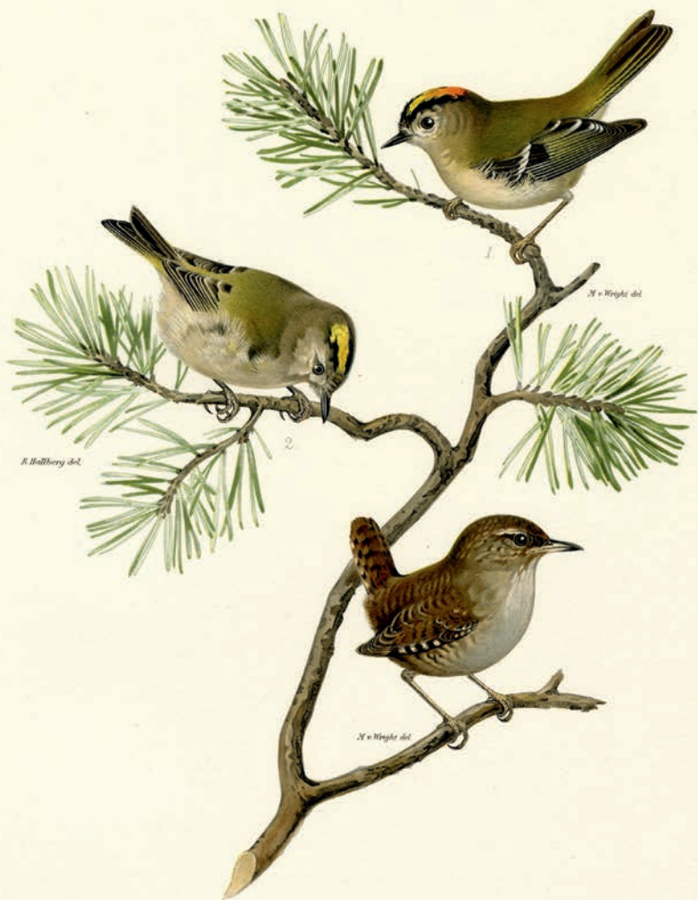
NANNUS TROGLODYTES LIN. Gårdsmyg.